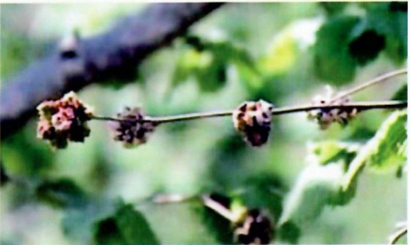
Fındık kozalak akarının oluşturduğu kozalaklar

Kışı kozalaklar içinde geçirip ilkbaharda yeni açılan yaprak koltuklarındaki ikinci yıl sürececek tomurcuklara girerek beslenme ve üremelerine devam ederler. Temmuz ayından itibaren tomurcuklarda şişmeler başlar, Ağustos ayında ise nohut büyüklüğüne ulaşır.